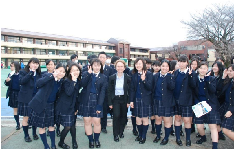
帰り、1年生が外まで見送りました。