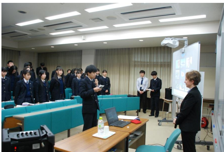
講演終了後、生徒がお礼の言葉を述べました。