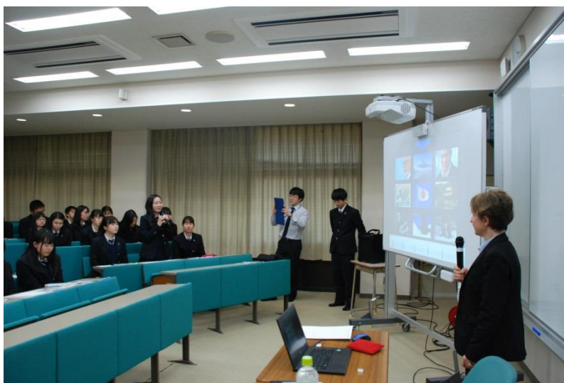
質問タイム、アガットさんに疑問点を質問。