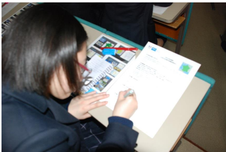
公演中熱心にメモをとる生徒。