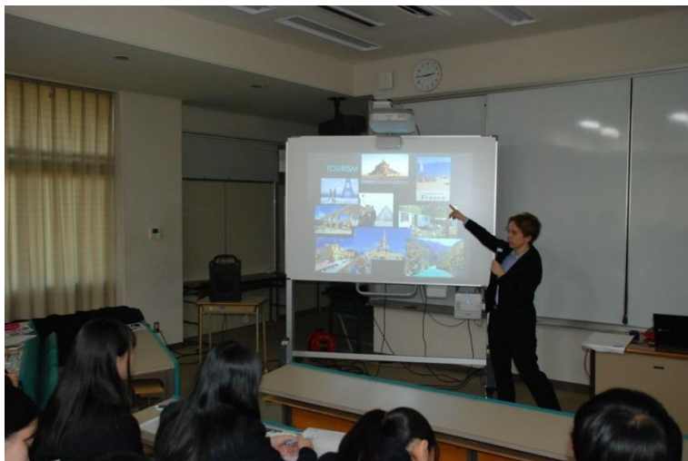
熱の入った講演は続きました。