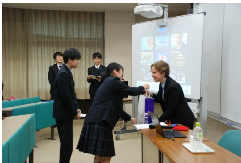
生徒からお土産が渡されました。「水戸」の詰め合わせ。