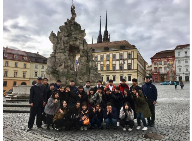
チェコ、ブルノの自由広場にて。笑顔 120%