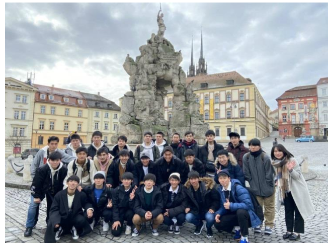
12時間のフライトに耐えたかいのある、素敵な写真が撮れました！