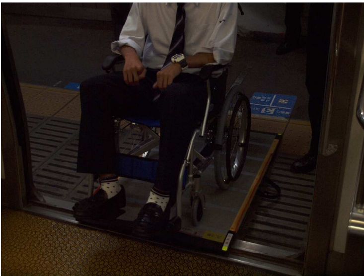
電車とホームの間に溝 「全然平気！」