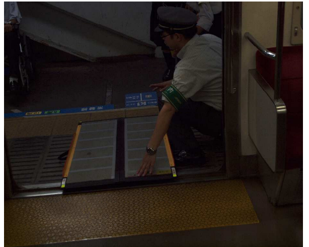
これが噂の「ケアスロープ」