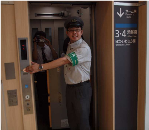
エレベーターでホームに降りますよ