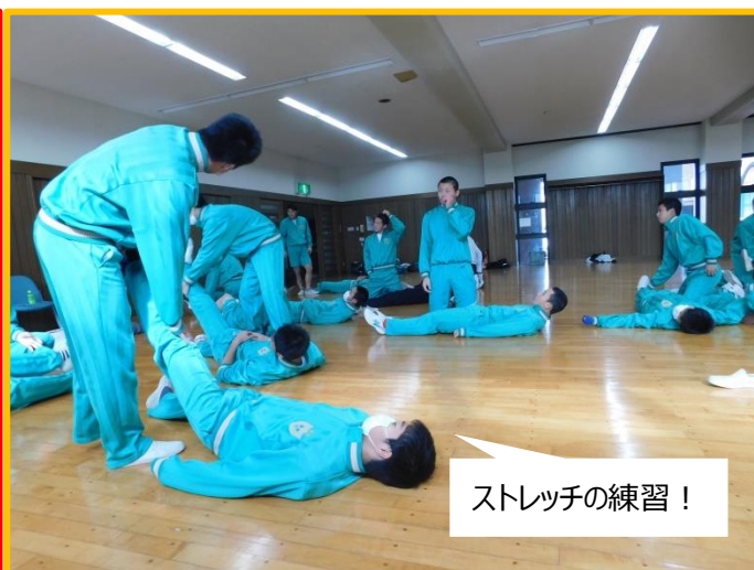
ストレッチの練習！