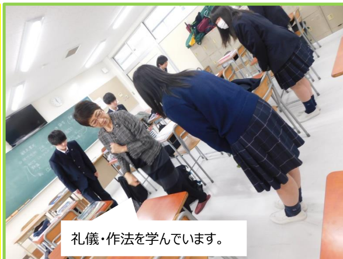
礼儀・作法を学んでいます。