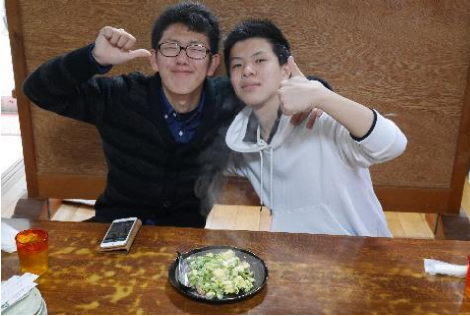
ホテルで夕飯です。