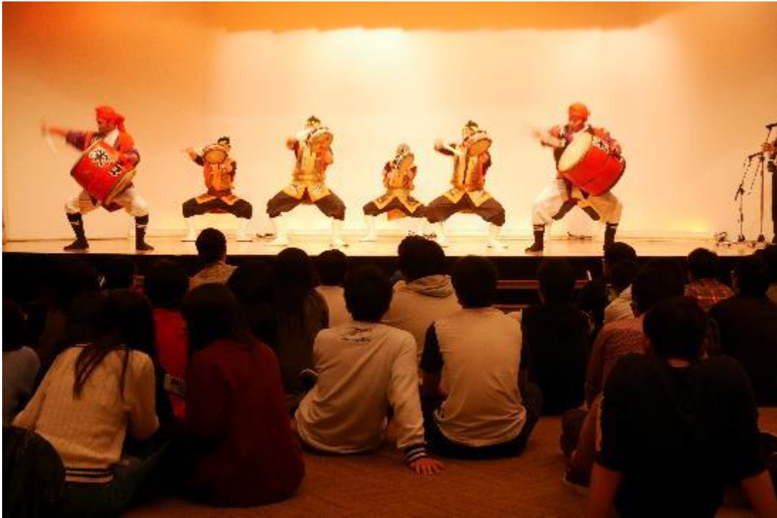
エイサーの体験。いい音色が響いてました。