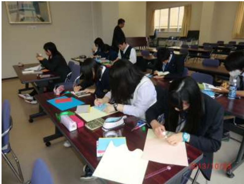
POPを作成していました。