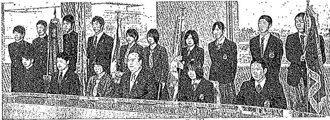
橋本昌知事を表敬訪問した全国大会出場校の選手たち＝県庁