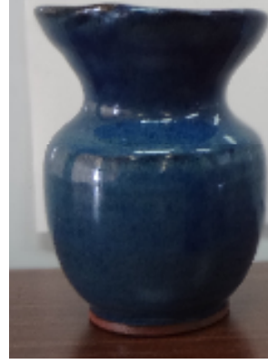
岩間 広樹 作