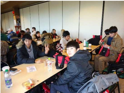
あっという間に食べ終わりました。