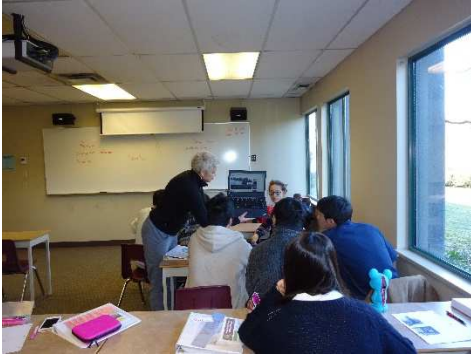
先生も画像を見せて、丁寧に教えてくれます。