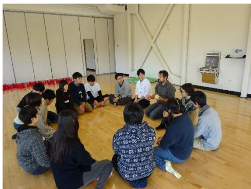
チームビルディングが始まりました。