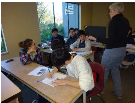
午前中は、今日までの活動をプレゼンする準備。