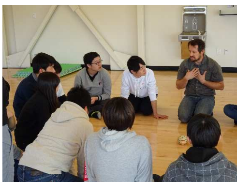
指導員の説明を真剣に聞く生徒たち。