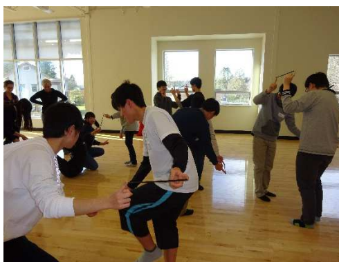
お箸を使ったゲームが始まりました。