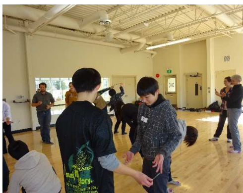
こっちも楽しんでいるようです。