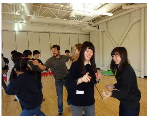
楽しんでいるようです。