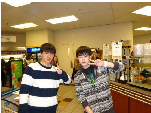
カフェテリアだけに「カニ」のポーズですか？