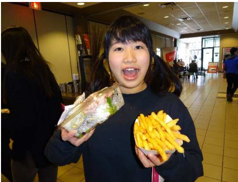
「やっぱり外国に来たらカフェテリアじゃね！」