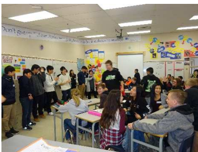
「水戸ちゃん」ダンスを披露