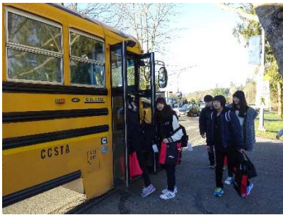
バスにて現地校へ