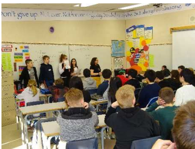
カナダ原住民についての紹介