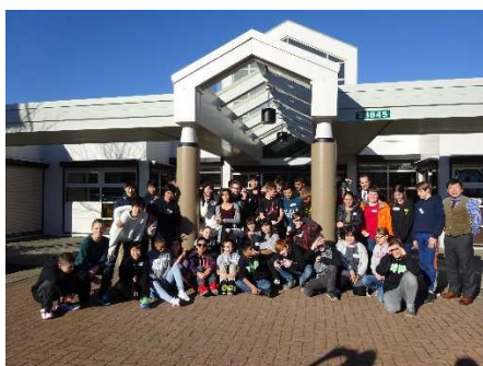
最後にみんなで一枚