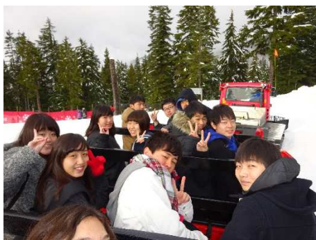
雪上車でさらに山頂へ。