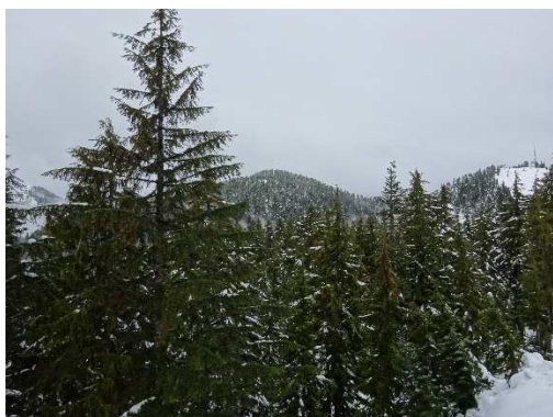
以上、本日は雪のカナディアンロッキーでした。