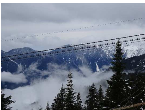
雪をかぶったカナディアンロッキーの山並み。