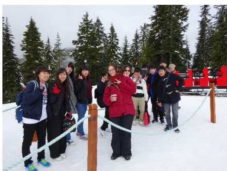
カナダ人と日本人の服装の違いをご覧ください。